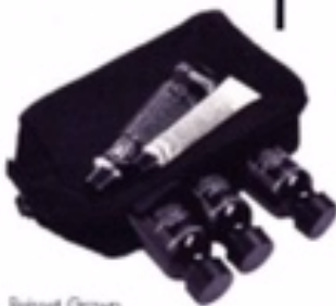
Reukset, Crown Alchemist bij The Reflection in Antwerpen, 69 €