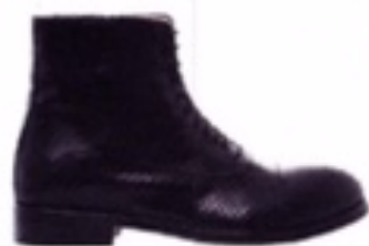
Kalfskan bottine met reptieleffect, Atelier Content, 290 €