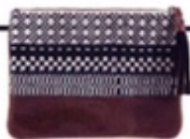
Ethnovoornmake-up of andere spuljes die anders door je handtas worden opgeslokt, Sesson, 7990 €