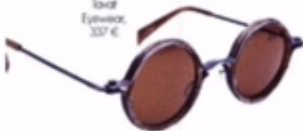
Zonnebril, 'soaf' Eyewear, 337 €