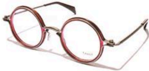
ROUND C LGR 47 $3,375

一副好的眼鏡除了鏡片之外，鏡框也十分重要。同時這個部分也是最花時間和工序來製作的。TAVAT的鏡框並不採用板材製作，卻選用金屬製作，於意大利設計及以人手打造出具鋼鐵質感的鏡框。這次的系列最特別的地方是採用了品牌自家研發的SOUP CAN技術，全副鏡架並無一顆螺絲，卻是把罐頭栓實的原理轉化為製鏡技術，減低氧化機會令眼鏡更加耐用之餘，配戴者更能隨時自行調節鬆緊。