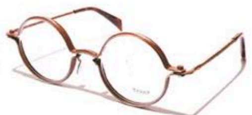
ROUND M BRZ 49 $2,565