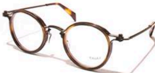
PANTOS C BTH 47 $3,375