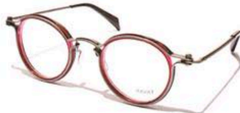
PANTOS C LGR 47 $3,375