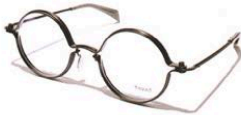
ROUND C BCY 47 $3,375