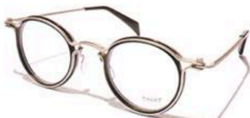
PANTOS C BCY 47 $3,375