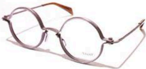
ROUND M DNM 49 $2,565